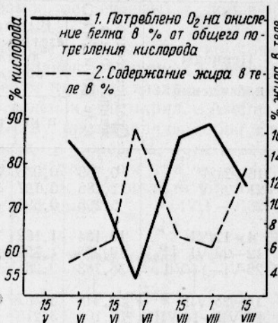
Рис. 2. Зависимость окисляемости белка от степени жирности тела сазана.

Последним из рассматриваемых нами элементов азотистого баланса является азот экскрементов. В первых пяти пробах экскременты не собирали, а содержание азота в них определяли совместно с азотом конечных продуктов белкового обмена. Только в последних четырех пробах было проведено специальное определение азота в экскрементах (табл. 7).