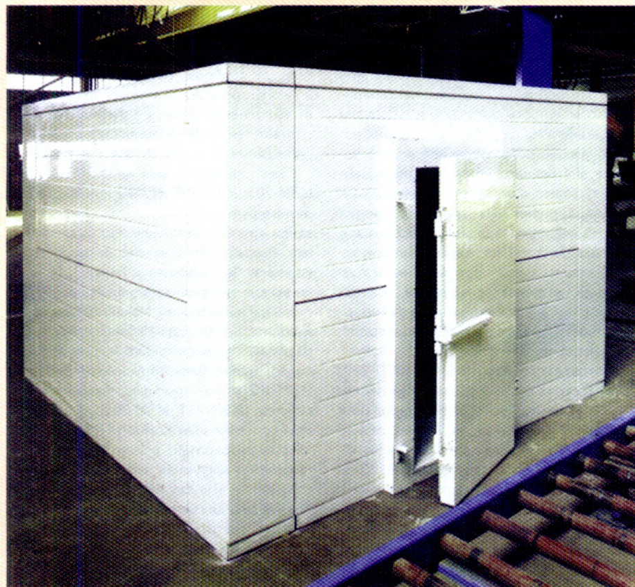
Модули холодильных камер вместимостью от 5 до 10 т

Адрес: 472312, Республика Казахстан, Карагандинская область, г. Темиртау. Телефоны: 5-39-07, 5-96-03, 5-38-17. Тел./факс 1-19-49.